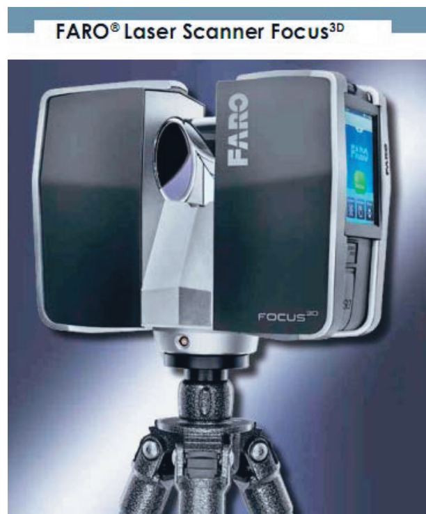
Figur 5. Laserutrustning användbar i tunnlar

Laser används för att mäta in tunnlar och berggrum. En 3D bild skapas där avstånd kan mätas. Upprepade mätningar gör att förändringar kan identifieras. Tekniken tillämpas idag både under och ovan jord. Utvecklingsarbete pågår i flera länder, se Figur 5. Utvecklingsarbete pågår i flera länder.