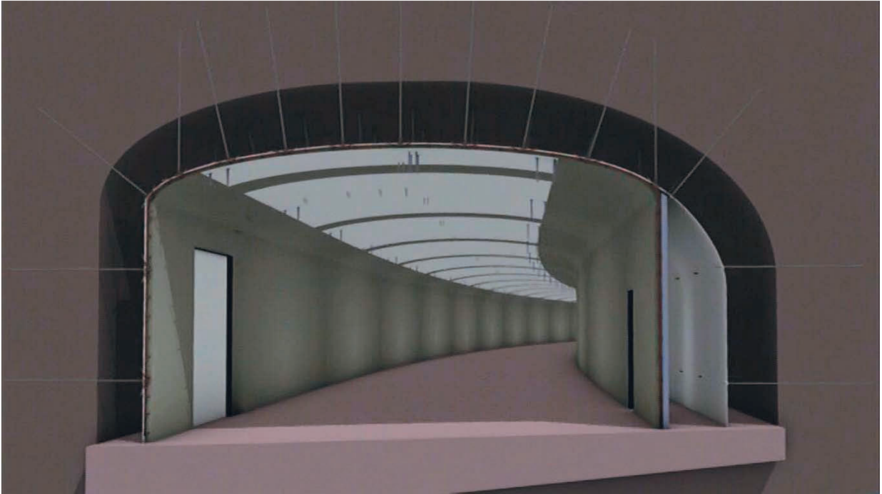
Figur 3. Tunnelvalv monterat på Norra länken i Stockholm. (Efter Veidekke AB).