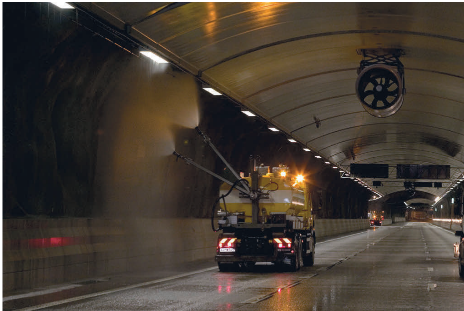
Figur 1. Mobil utrustning för tunneltvätt

I många fall verkar kraven på renspolning och belysning i tunnlarna vara relativt nedprioriterade faktorer, vilket gör inspektionsresultaten tveksamma i vissa fall, se vidare nedan. Entreprenadföretaget Svevia har konstruerat en mobil utrustning för renspolning av främst vägtunnlar, se Figur 1 nedan.