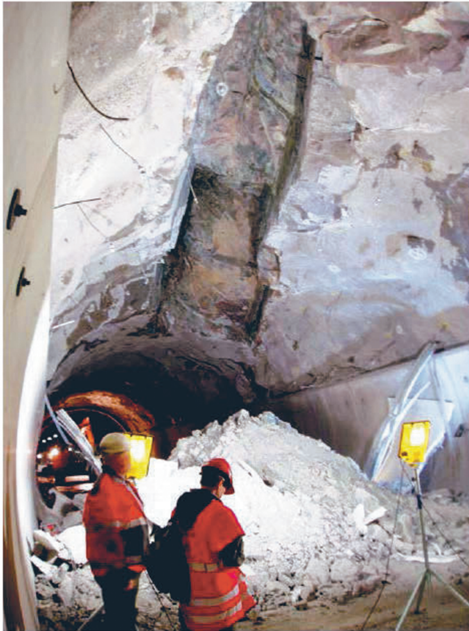
Figur 5. Raset i en sprickzon i taket på Hanekleiva tunneln.

Rasen i norska tunnlar har föranlett vissa organisatoriska förändringar; bland annat ges numera beställaren alltid möjlighet att kartera berget. Detta sker med hjälp från entreprenören, vars arbete med detta är en prissatt post i mängdförteckningen. En avgörande skillnad mot tunneldrivning i Sverige är fler beslut tas ”på stuff” av drivningspersonalen. Detta kan eventuellt betyda, att alla designkriterier inte alltid beaktas, såsom exempelvis bergtäckningen, närheten till andra anläggningar, bergmassans egenskaper och anläggningens långtidsbeständighet.