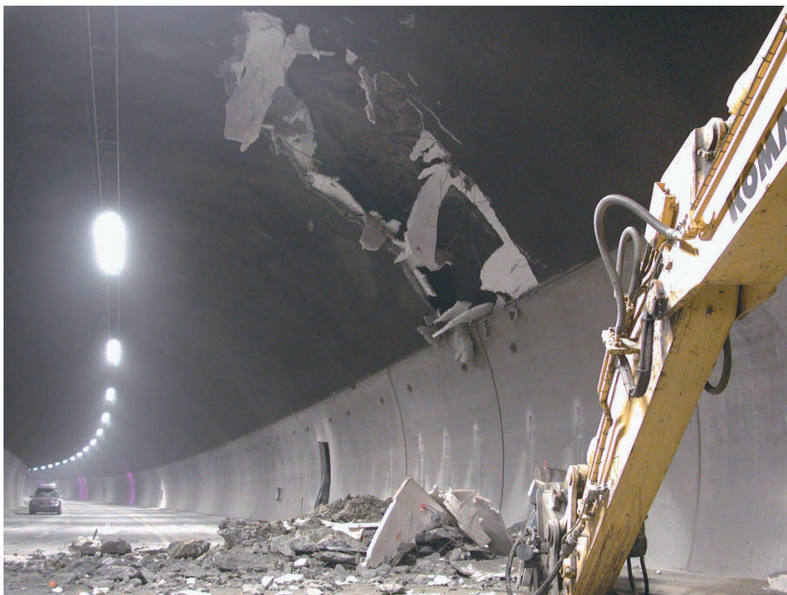
Figur 4. Ras i berget bakom inklädnad med PE-skum och sprutbetong, så kallad Vatten- och Frostisolering. Raset inträffade 2003, 3 år efter att tunneln var klar. 2004 gjordes inspektion bakom inklädnaden då flera mindre ras påträffades. Tunneln fick återigen stängas för reparationsarbeten.

Under projekteringen av Götatunneln gjorde projektledningen flera besök under den kritiska perioden vid byggandet av Dröback-tunneln. Stora likheter i de geologiska och bergtekniska förhållandena gjorde att riskanalyser gjordes med norska erfarenheter, bland annat utvärderades behovet av katastrofslussar för ett potentiellt vattengenombrott.